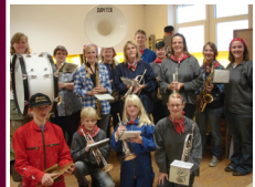
In de boerenkieltjes