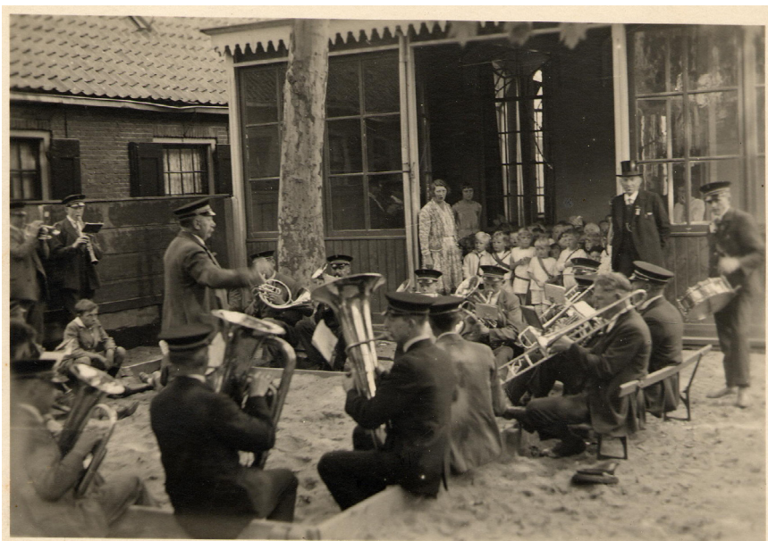
Het comfort van optredens rond de jaren '50